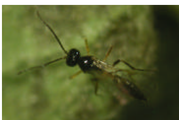
コレマンアブラバチ成虫