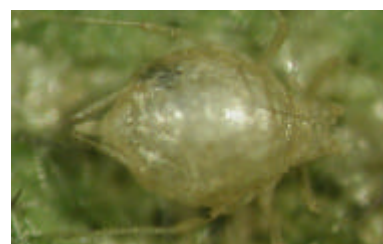
寄生されたワタアブラムシ(マミー)