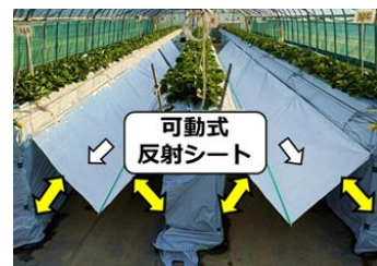
【①展開時の可動式反射シート】