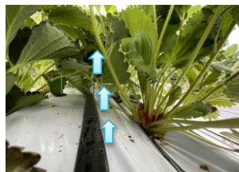
【②チューブでCO 2 を局所施用】