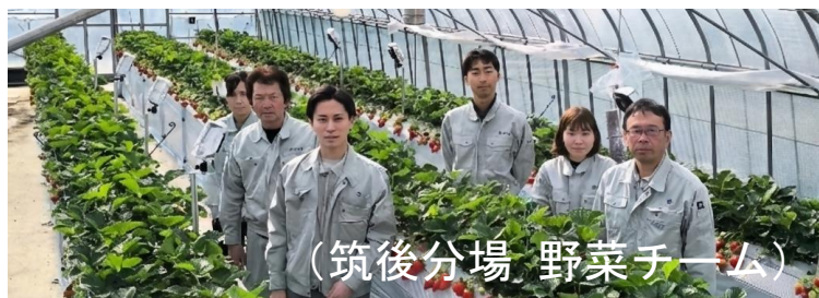
(筑後分場 野菜チーム)