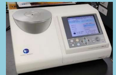
テアニン・色相角度の測定