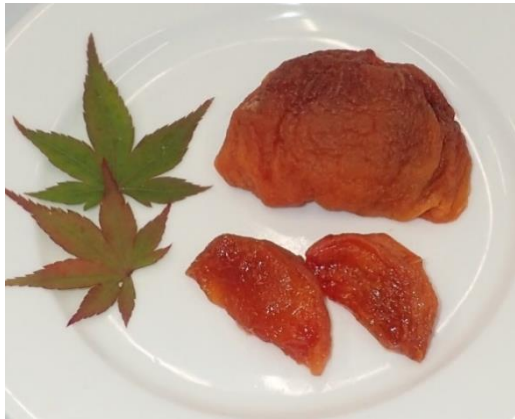
図2 二段階乾燥法により製造したソフトタイプの干し柿