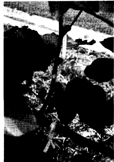
第3図 ‘姫蓬萊’一文字整枝樹の着果状況