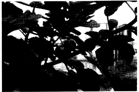
第4図 ‘姫蓬菜’の秋果結実状況