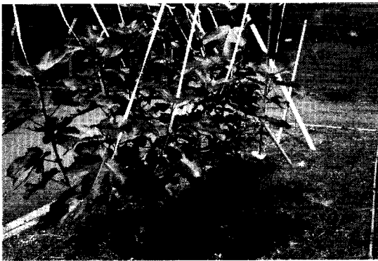
第2図 ‘姫蓬萊’の一文字整枝樹