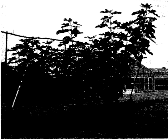
第1図 ‘姫蓬萊’の原木（樹齢8年生）

枝梢の粗密は‘榊井ドーフィン’と‘蓬萊柿’の中間程度で、頂部優勢性も両品種の中間程度である。結果母枝当たりの新梢（結果枝）発生本数が‘蓬萊柿’より多いことから、‘榊井ドーフィン’同様に一文字整枝に仕立てることは容易であり、その場合の着果性も良好である