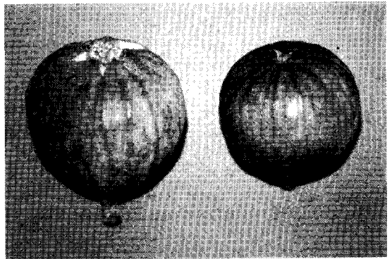
第5図 秋果外観(左:‘蓬菜柿’ 右:‘姫蓬菜’)